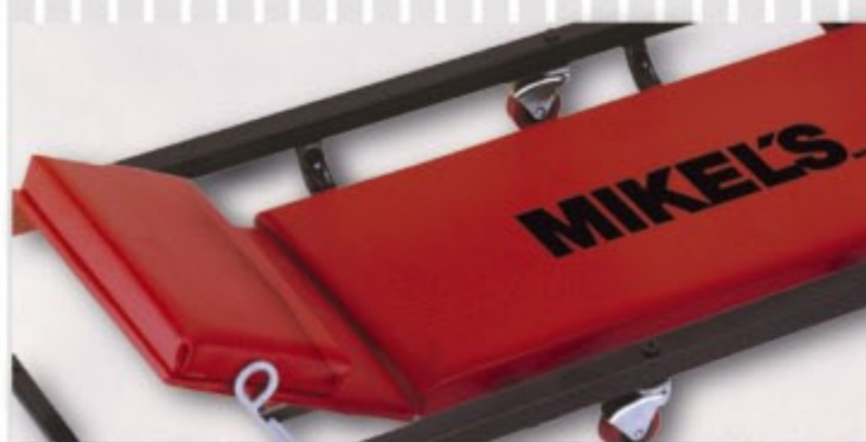
CABECERA Y RESPALDO ACOLCHONADOS PARA UN MÁXIMO CONFORT.