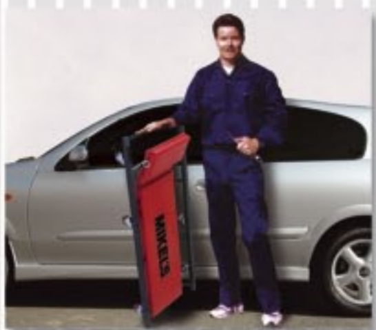
DISEÑO LIJERO QUE PUEDE SER TRANSPORTADO FACILMENTE.