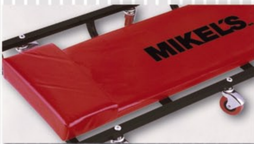
CABECERA Y RESPALDO ACOLCHONADOS PARA UN MÁXIMO CONFORT.