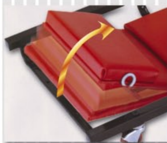
MANIJA AJUSTABLE PARA CABECERA CON TRES POSICIONES.