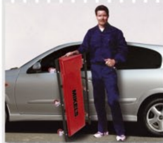
DISEÑO LIJERO QUE PUEDE SER TRANSPORTADO FACILMENTE.