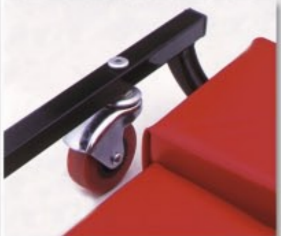
6 RUEDAS GIRATORIAS DE MÁXIMA DURABILIDAD (360°).