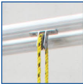
Sistema de elevación de cuerda y polea.