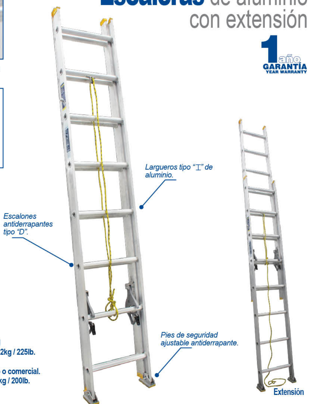
Escalones antiderrapantes tipo "D".