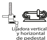
Lijadora vertical y horizontal de pedestal